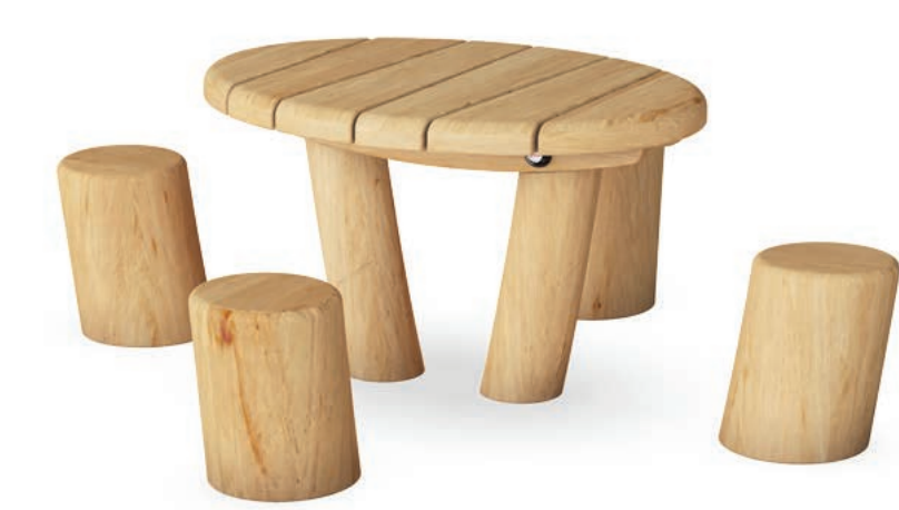
tafel met vier zitpaaltjes

Een nieuwe zandspeelplaats wordt gecreëerd, met aan de zuidzijde een heuvel voorzien van een talud glijbaan.