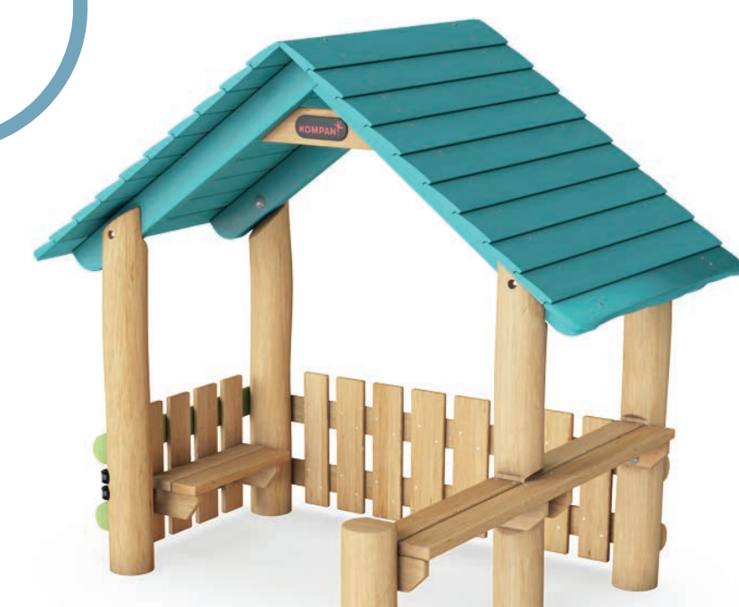
speelhuisje met balie

Er worden twee parkeerplaats tegels geplaatst.