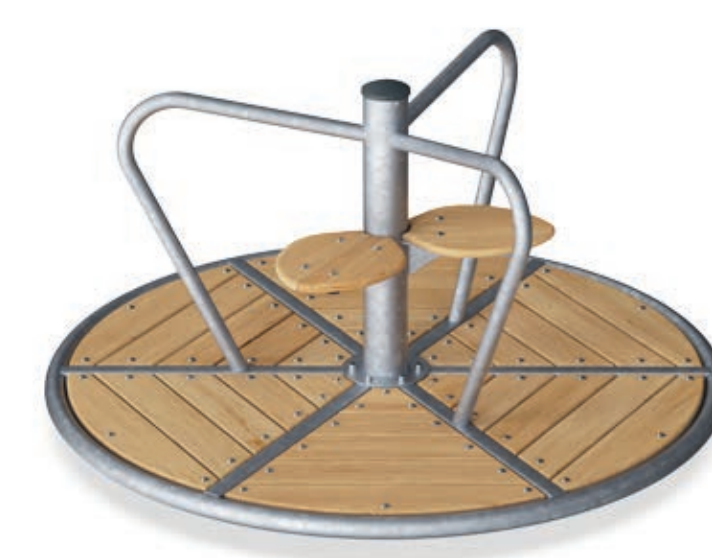
draaicarrousel met twee zitjes

De mandschommel wordt geplaatst bij de bomen om schaduw te bieden, geschikt voor passief spel.