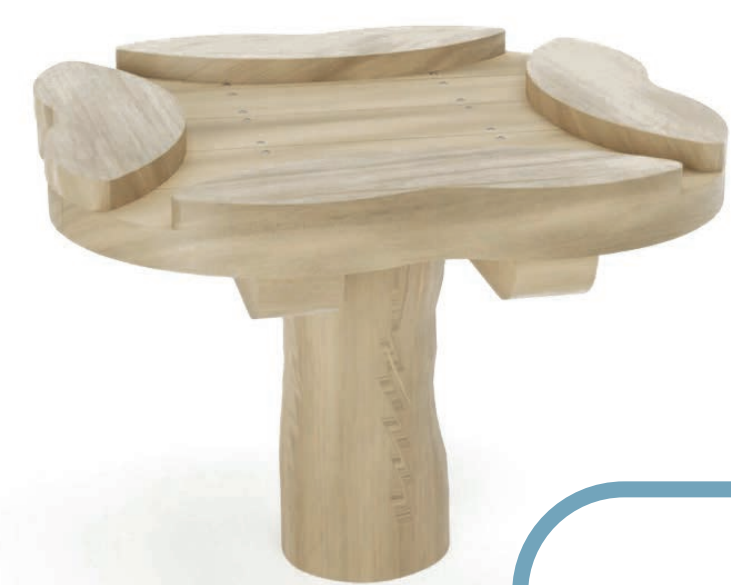
podium met zandtafel

Naast het speelhuis plaatsen we drie schommels: een schommelzitje voor peuters, een gewone schommel en een vogelnestschommel. Aansluitend op de vogelnestschommel wordt een nieuw 3-delig duikelrek geplaatst, wat goed past binnen een spelzone voor toestel gebonden spel.