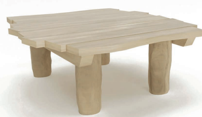
podium met zandtafel