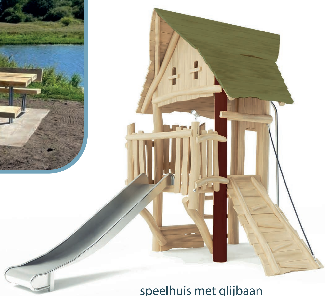
speelhuis met glijbaan

Voor het stimuleren van bouw- en fantasiespel plaatsen we naast de zandbak een speelhuis met glijbaan. Speciaal bedoeld voor de jongste kinderen. De zandbak blijft en hierin plaatsen we een speelpodium en zandtafel.